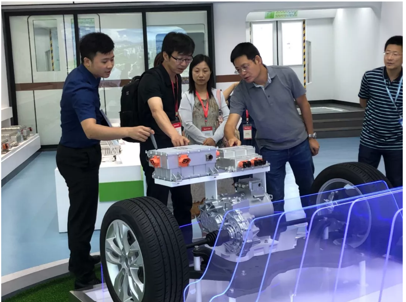
赴中车株洲所 商议战略合作